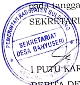
I PUTU KARYAWAN

Diundangkan di Banyuseri pada tanggal 10 Januari 2022 SEKRETARIS DESA BANYUSERI,