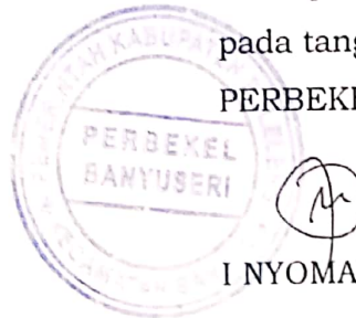
I NYOMAN WITADA

Ditetapkan di Banyuseri pada tanggal 10 Januari 2022 PERBEKEL BANYUSERI,